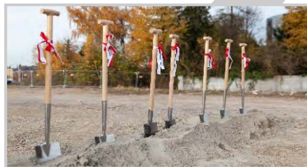
2018: Spatenstich neues Firmengebäude