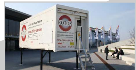
2009: Markteinführung Miet-USV