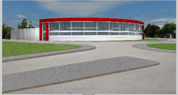
2020: Bezug Firmensitz in Bretten