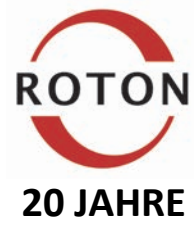
2019: 20-jähriges Bestehen