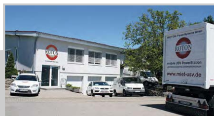
2004: Umzug nach Neulingen